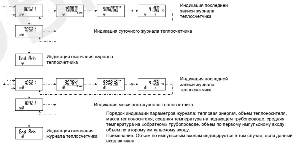
Рисунок 2. Индикация журналов на индикаторе теплосчетчика

6.10.3 При нарушении целостности проводов датчиков расхода и температуры возможна индикация дополнительных символов «OP U» (обрыв соединительных проводов) или «SH U» (короткое замыкание соединительных проводов). При индикации разности температур и невозможности ее корректного вычисления на индикаторе отображаются символы «nA».